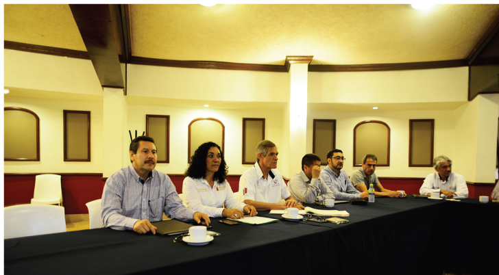
Foro Estatal de presentación de resultados