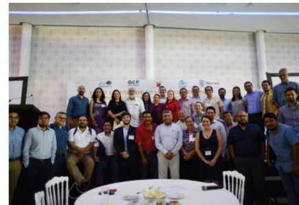
Asistentes al Foro Estatal

Se hizo incapié en que La ley de Desarrollo Rural Sustentable ha determinado la obligatoriedad de establecer mecanismos de articulación de las estrategias de política pública a través de procesos institucionales de planeación y gestión que permitan, la mayor concurrencia y sinergia de las distintas intervenciones que el Estado realiza en apoyo a la agricultura y la prosperidad rural.