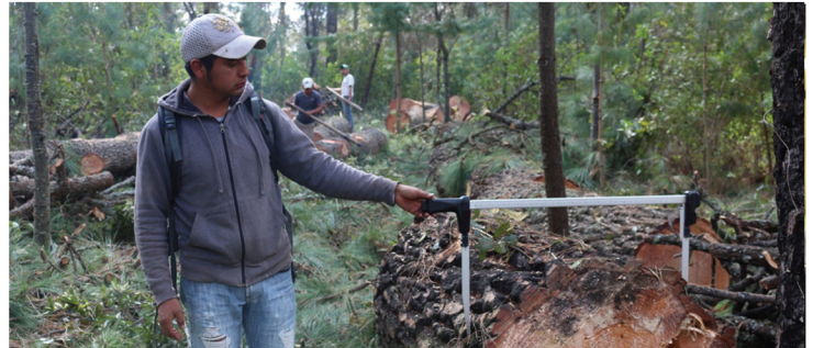
Toma de muestras en campo

En la edición del mes de Agosto del 2018 de este boletín de información, presentamos una nota sobre el arranque del proyecto para elaborar un sistema de modelos biométricos para la planeación del manejo forestal en el Estado de Chiapas financiado por el Fondo Sectorial CONAFOR-CONACYT. A partir de ese momento se inició con la etapa de toma de muestras en dos zonas de reactivación forestal conocidas como zona Norte Altos y la zona Costa Sierra Chiapas. Se identificaron las especies más importantes y se derribaron y seccionaron 150 árboles aprovechando las áreas de corta de los predios. La siguiente etapa del proyecto, fue la creación del Sistema Biométrico