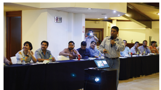
Presentación Dr. Javier Corral

Este sistema biométrico establece una base científica sólida para el aprovechamiento del manejo sustentable de las especies de mayor importancia económica, colocando a Chiapas dentro de los Estados con mayor potencial de producción de madera en México, además de que contribuye al diseño, formulación, ejecución, evaluación y monitoreo de los programas de manejo forestal de las comunidades y predios del Estado.