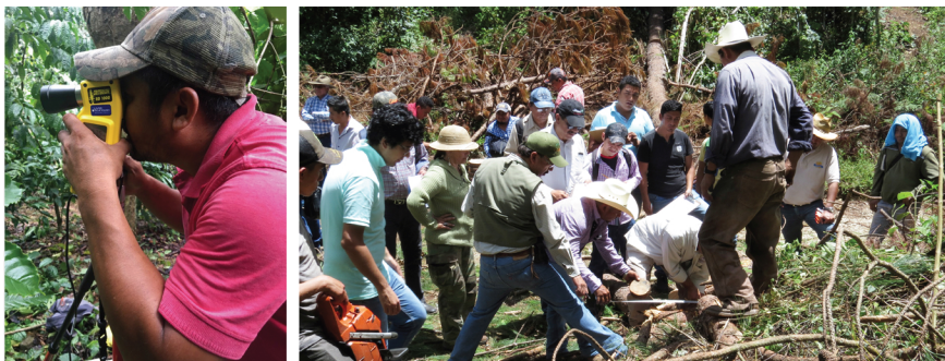
Toma de muestras en campo